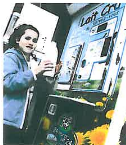
Le distributeur de lait cru installé sur le parking du centre commercial Carrefour, ZI des Blanchisseries

Ces initiatives sont soutenues par la communauté d'agglomération du Pays Voironnais qui dispose de la compétence agriculture. Avec le projet de